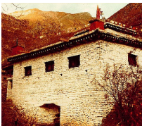
The "Temple Of Miraculous Fire" at Muktinath, Nepal.

[For more on this subject, please read our tract The Temple Of Miraculous Fire .]